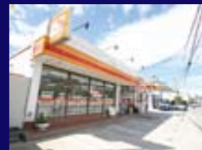
ヤマザキショップ...270m

JIOの基礎仕様計画書に沿って施工(地盤改良工事が必要な場合、検査を受けて合格していること。)した物件は地盤と建物の一体保証を致します。万一、地盤に起因して建物に瑕疵が発生しても安心です。