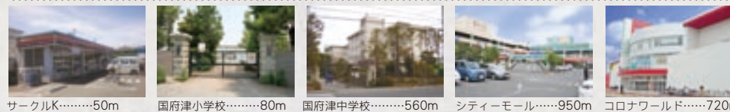
サークルK.....50m 国府津小学校.....80m 国府津中学校.....560m シティモール.....950m コロナワールド.....720m