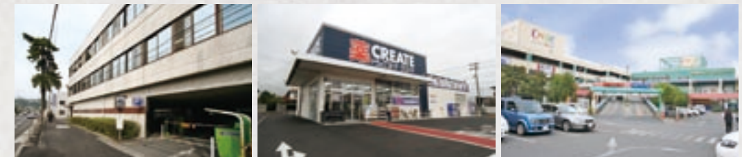
山近記念総合病院...450m クリエイトS・D...450m シティーモール...900m