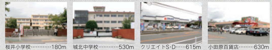
桜井小学校.....180m 城北中学校.....530m クリエイトS・D.....615m 小田原百貨店.....630m